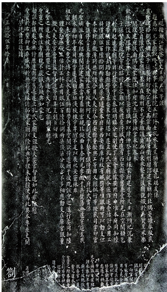
明正德唐凤仪等·呈部记事碑

据韩章训的研究，南宋宝祐三年（1255），衢州知州孙子秀请建家庙于衢州菱湖畔，宋末毁于兵燹；元初，衍圣公孔洙重建家庙于城南，規制远逊于宝祐；崇文坊家庙为明代永乐至正德年间南宗奉祀孔子的场所；正德十五年（1520）迁家庙于新桥街家庙，此为家庙的最后迁徙之地 [17] 。菱湖家庙主要祭祀区的建筑布局与曲阜孔庙一脉相承，崇文坊家庙规模不大但功能完备，新街桥家庙作左庙右廊 [18] 。明中期以后有几次大规模的修葺：明万历十二至十六年（1584—1588）间知府廖希元对孔氏家庙进行维修、清顺治元年（1644）曲阜孔子63世孙知西安县孔贞锐修庙、清康熙二十一年（1682）衢州郡垂杨道泰重修、雍正八年（1730）修葺、乾隆四十三年（1778）维修、道光元年（1821）十月至三年（1823）四月修葺、同治六年（1867）重修等 [19] 。家庙的建筑构成主要有：照壁、先圣庙门、大成门、大成殿、寝殿、思鲁阁、启圣祠、报功祠、五支祠、袭封祠、六代公爵祠、世袭博士府、圣泽楼、家塾；家庙的建置深受儒家礼制思想和宗法伦理道德观念的影响，庙内五支祠（祀孔子家族五房之祖）、六代公爵祠（南渡后孔端友至孔洙的六代衍圣公）、袭封祠（孔彦绳至孔庆仪