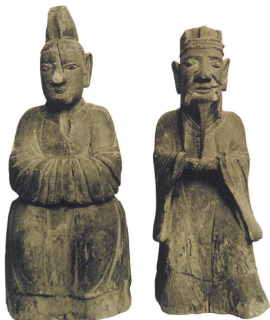
孔子及元官夫人楷木雕像

十五代翰林院五经博士)的设立体现了儒家思想中的等级尊卑、三纲五常的宗法思想;等级观念反映在建筑上就是空间布局的主次分明,各个单位建筑的方整、对称体现了儒家“正心”“正物”“正位”的观念,南宗家庙正好是中国伦理社会的一个缩影 [20] 。南宗家庙与曲阜孔庙都采用庭院式廊庑建筑,受庙学并存思想的影响,有书院、国子监学宫、学校等配套建筑,形成庙学合一的建筑群;山东曲阜孔庙由于历代皇帝的祭祀,享受皇家的建筑规格,建筑时间久远、规模宏大、保存完整,而南宗孔庙由于南宗失爵变得比较平常,但也由于这一缘故,所设立的思鲁阁为南宗家庙所独有 [21] 。南宗家庙的修建、移址及兴衰,记录自南宋以来各个历史时期的社会状况、孔氏南宗后裔的生活状况,可以说南宗家庙是南宗历史最好的见证 [22] 。现存浙江境内孔庙遗存分为整体较好、主体完好、基本毁坏、发掘重建四类遗存状态,许多孔庙遗存也被列入文物保护单位,并得到保护、利用与研究 [23] 。除了以上提到的对南宗家庙研究之外,还有许多学者们对于孔氏南宗家庙历史沿革、家庙规制进行了探讨 [24] 。