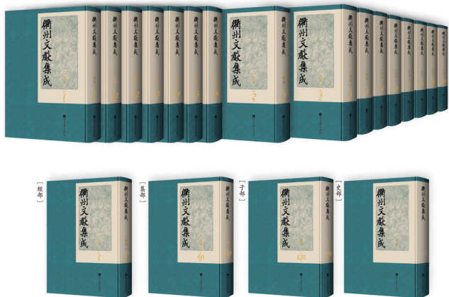
《衢州文献集成》书影

乞南迁，世祖嘉之曰，宁违荣而不违亲，真圣人后也。拜承务郎国子祭酒，兼提举浙东学校，给奉养廉并与护持江南林庙玺书，正宗之罢封，自此始 [4] 。