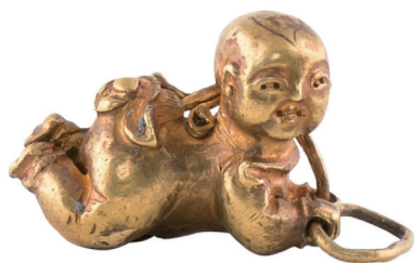
衢州市博物馆藏南宋金娃娃