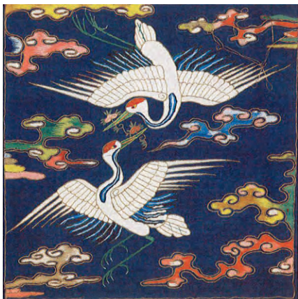
图 11: 蓝纱交领袍之仙鹤补子(曲阜文物管理委员会孔府文物档案馆藏)