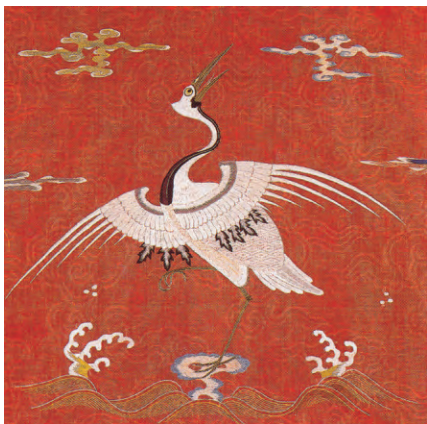
图 12: 红罗袍之“一品当朝”补子(山东博物馆藏)

较为遗憾的是, 这些传世服装缺乏具体的时代、服用对象、服用场合、穿着配伍等信息的确切记载, 并且已有的服装称谓与描述方式, 乃至服装尺寸信息均有不准确或难以理解的地方。笔者在研究过程中, 尽量从多渠道甄别已知信息。由于已知孔府旧藏文物的珍贵特性, 只能在展览或图录窥其貌, 尤其是只见于图录服装, 对其内部构造只能一边想象, 一边期待能够见到真正的文物。对孔府旧藏明代服装的研究还需要与未来发现的新资料作比较研究, 以及近距离观测实物, 才能得出更准确的结论。无论如何, 经由如上的综述与分析, 笔者对孔府旧藏明代传世服装作了初步的整理, 对其形制等内容