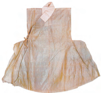
图7：搭护（曲阜文物管理委员会孔府文物档案馆藏）