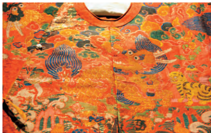
图5：彩织四兽红罗袍局部（山东博物馆藏）