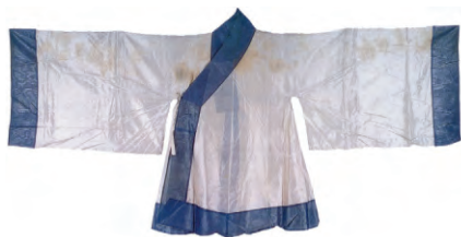
图4：朝服之白纱中单（山东博物馆藏）