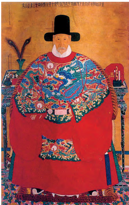
图9：第六十四代衍圣公孔尚贤衣冠像