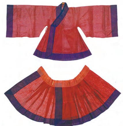
图3: 朝服之赤罗衣、裳(山东博物馆藏)

单位,记录了袍、衣、便服的尺寸,包括有衣长、袖长、袖肥、腰身、台肩、下摆、领子、后身、裙腰等部位,遗憾的是这份清单记录数量仅为9件。