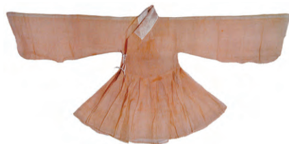
图8：贴里（曲阜文物管理委员会孔府文物档案馆藏）