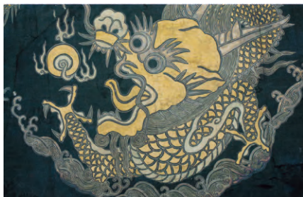
图6：绿绸画云蟒纹袍局部（山东博物馆藏）