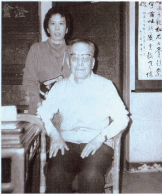
1998年11月作者与任继愈先生合影

新选择的后堂佛楼下做新的档库房排好橱柜，进行分类度藏。就这样，先父单士元等人与保管所数人，用了一周时间间断完成了初步整理工作。他在文中的最后写道：“对于孔府档案文献，由于比中央历史档案馆所藏之档史料内容，更加具体又有基层性特点，因此是研究我国封建社会制度的极其珍贵的历史资料。”